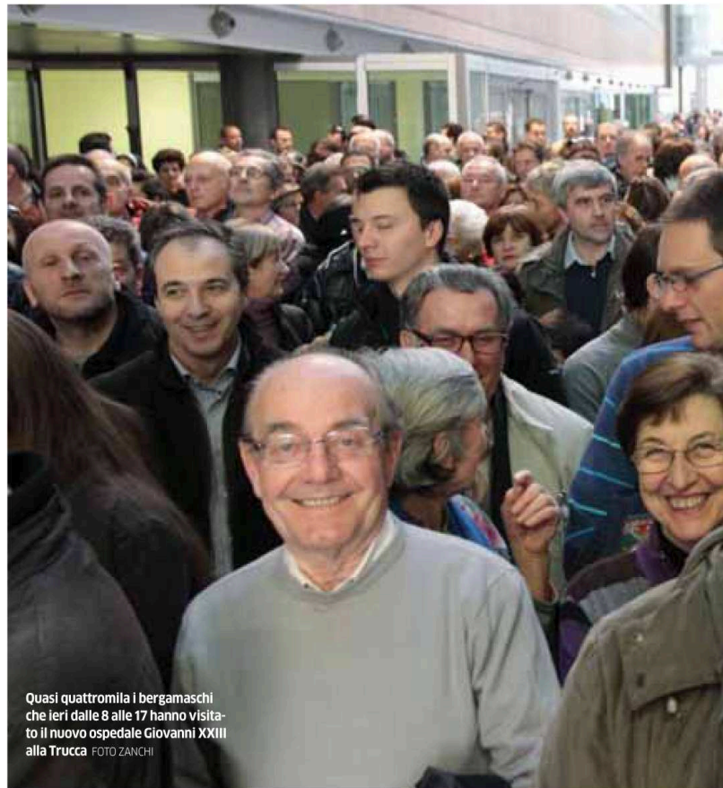
Quasi quattromila i bergamaschi che ieri dalle 8 alle 17 hanno visitato il nuovo ospedale Giovanni XXIII alla Trucca.

Tanti i bambini che hanno accompagnato i genitori, il più piccolo a varcare l'ingresso dell'ospedale ha solo un mese. Diversi anche i disabili che hanno preso parte all'open day e hanno potuto riscontrare di persona la mancanza di barriere architettoniche e l'accessibilità ai vari piani. Dato l'afflusso, superiore anche alle attese dell'amministrazione, alcuni bergamaschi hanno preferito evitare la fila e rinunciare alla visita. L'Associazione carabinieri si è occupata della viabilità della zona, evitando ingorghi, presenti con un mezzo anche i volontari della Croce rossa, mentre la Protezione civile ha contribuito a indirizzare l'afflusso dei visitato-