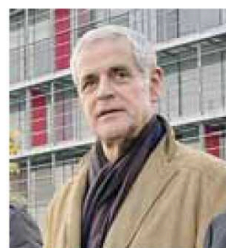
Formigoni ieri all'open day

«L'ospedale aprirà entro il 2012», ha dichiarato Formigoni, che ha aggiunto scherzosamente: «Le malelingue che dicono il contrario saranno tagliate». Durante il percorso all'interno dell'ospedale sono state illustrate al presidente della Lombardia le caratteristiche degli impianti all'avanguardia che saranno installati: dall'apparecchio per la chirurgia senza bisturi, che usa la radioterapia per trattare i tumori, alle «tartarughe», sorta di automi porta carrelli che robotizzano tutta la logistica dell'ospedale. «I macchinari sono di ultima generazione, siamo alla ricerca dell'eccellenza nella progettazione e nelle tecnologie. Raccoglieremo le attrezzature più avanzate al mondo. Sarà l'ospedale che