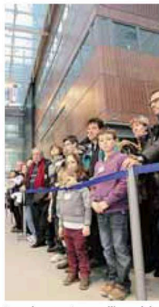
La coda per entrare nell'ospedale

Nel giugno 2007 i visitatori saranno 4 mila 200 (un record), un anno dopo invece 2 mila. Ieri il doppio, in un appuntamento fuori stagione, perché mai si era tenuto a novembre e perché soprattutto il «Giovanni XXIII» avrebbe dovuto essere già aperto. Nel suc-